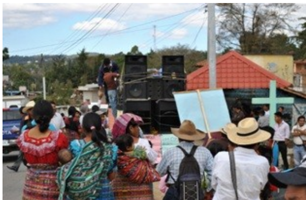
Segundo aniversario de la consulta popular de Chinique (Quiché) 14.03.14