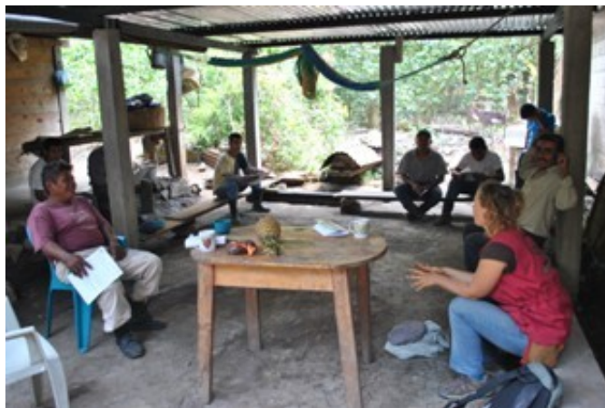
Reunión en Finca La Primavera, San Cristóbal (Alta Verapa) 12.03.2014.

En marzo, hemos mantenido contacto periódico y varias reuniones con miembros de la Unión Verapacense de Organizaciones Campesinas (UVOC) . Viajamos dos veces a la finca La Primavera y observamos la investigación de la Instancia de Análisis de Ataques contra Defensores de Derechos Humanos sobre los hechos del 15 de febrero, cuando dos empleados de seguridad privada de la empresa Eco-Tierra intentaron agredir a una mujer de la comunidad de Baleu; ella había cuestionado su proceder después de haberles visto talar árboles de la comunidad sin permiso (ver Paquete de Información Mensual 123 ). En el marco de su trabajo en búsqueda de soluciones a la problemática del acceso a la tierra, acompañamos a la UVOC a dos reuniones con la Secretaría de Asuntos Agrarios (SAA). A pesar de un diálogo regular entre los integrantes de la organización y la SAA, la UVOC manifiesta que existe una falta de voluntad por parte de las instituciones estatales para encontrar soluciones en los diferentes conflictos de tierra. También han mostrado su preocupación por la llegada de patrullas militares a la comunidad San Miguelito, en el valle de Polochic (Izabal). La población comunitaria denuncia una continua vulneración de derechos humanos por garantizar su derecho de acceso a la tierra y la amenaza constante de un desalojo por parte de la empresa Chabil Utzaj.