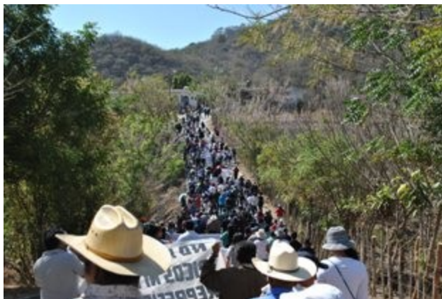
Segundo aniversario de Resistencia Pacífica de La Puya 02.03.2014

Este mes visitamos en tres ocasiones la Resistencia Pacífica de La Puya , que continúa instalada con un plantón permanente en esta localidad, en el límite municipal entre San José del Golfo y San Pedro Ayampuc (Guatemala). El 3 de marzo celebraron su segundo aniversario, donde hubo varias actividades, incluyendo una marcha de San José del Golfo al plantón, en la cual participaron más de 1000 personas según la organización. A pesar de las celebraciones, los y las integrantes de la resistencia siguen expresando su preocupación por la criminalización en su contra. Este mes continuamos acompañando a miembros de la resistencia pacífica a audiencias judiciales; en concreto a principios de mes estuvimos presentes para observar una audiencia judicial en la que fue abierto juicio contra tres de sus miembros . El día 18 acompañamos a las personas acusadas a otra audiencia donde se presentaron pruebas. Quedan pendientes de próximas audiencias, previstas en abril.