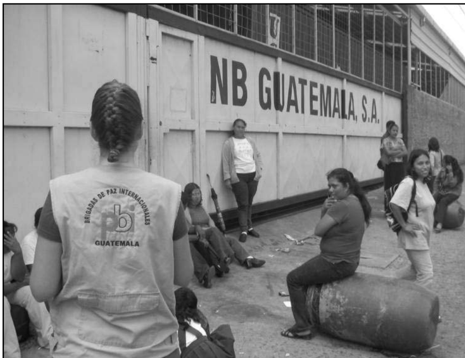
Acompañamiento a las mujeres del sindicato SITRA NB, durante un bloqueo de su fábrica. Julio 2005.

En Guatemala, la empresa Industria de Café es la propietaria de las plantas de Coca-Cola Norte y Sur así como de la planta de café instantáneo en la capital. La Unión Internacional de los Trabajadores de la Alimentación (UITA) menciona que se