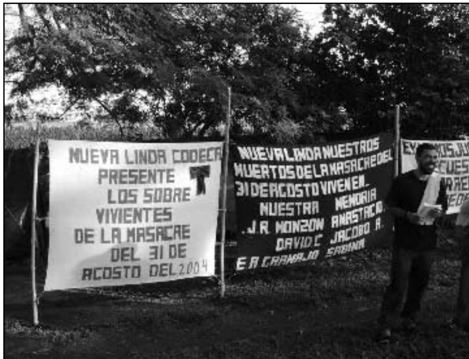
Mantas durante la conmemoración del primer aniversario del desalojo de la finca Nueva Linda.

El día 13 de octubre de 2003, unos 100 campesinos y campesinas de Monte Cristo y otras comunidades rurales ocuparon parte de la Finca Nueva Linda, para presionar a las autoridades de la Policía Nacional Civil (PNC) y del MP para que se llevara a cabo una investigación. Desde el principio el sector campesino se solidarizó con la ocupación; además los y las ocupantes recibieron mucho apoyo directo por parte de otros trabajadores rurales, lo que resultó