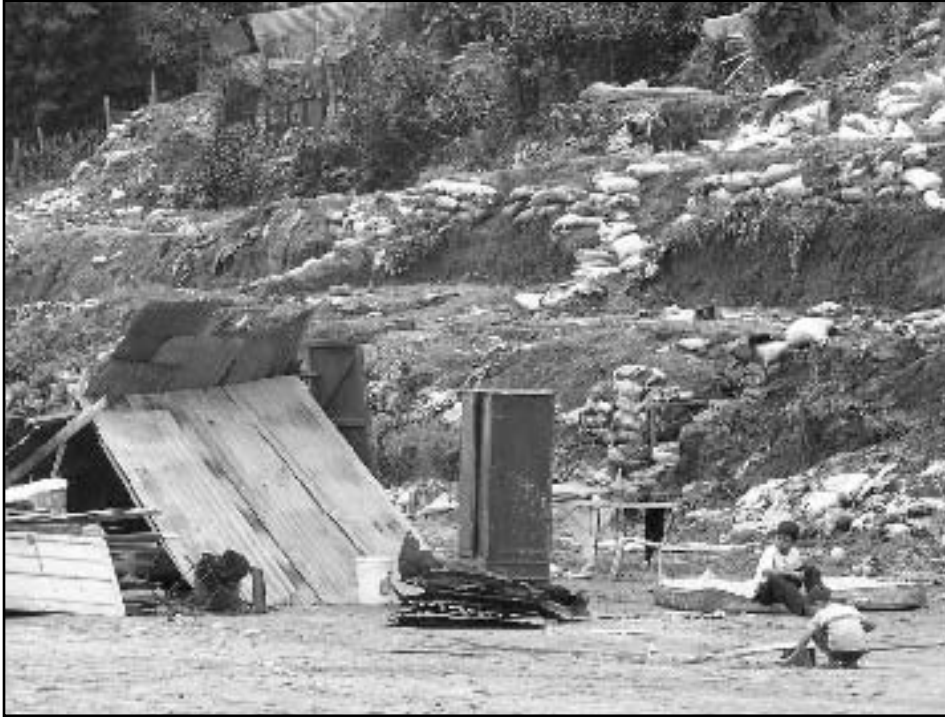
Pobladores de la comunidad Getzemaní recuperando lo que queda de sus pertenencias el día después del desalojo.

llevando, le decían que se fuera con ellos, entonces yo lo saqué de la escuela medio año para alejarlo de eso. El quiere seguir estudiando pero yo no puedo pagarle el estudio. Si es en un instituto público no los están recibiendo y además corren muchos riesgos por eso de las maras, entonces uno tiene que pagarles privado, pero no se puede. Con el tiempo no se tiene derecho ni a la educación.”