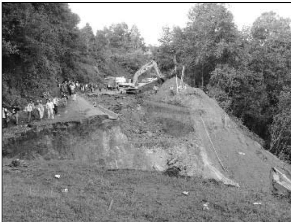
La carretera Panamericana cerca de Los Encuentros seriamente afectada por los derrumbes.

El Reporte de Inforpress Centroamericana, cita como ejemplo a la comunidad El Calvario de Alta Verapaz, la cual sufrió un derrumbe en el 2000 que mató a 13 habitantes. A pesar de los esfuerzos de las organizaciones nacionales e internacionales para reducir la vulnerabilidad de la comunidad, fuertes lluvias causaron otro derrumbe en el mismo punto en junio del 2005, matando a 22 personas y destruyendo