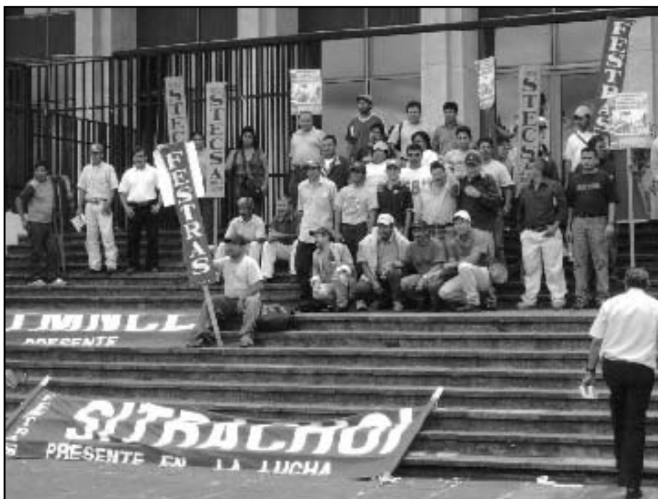
Los sindicalistas de SITINCA y afiliados manifestando en frente de la Palacio de Justicia.

La empresa de capital salvadoreño mantiene tres distribuidoras en Guatemala que se encuentran en Quetzaltenango, Chiquimula y Guatemala. El 10 de agosto de 2005 fue cerrada sin aviso previo la distribuidora en Mixco, Guatemala. Justamente aquella que cuenta con un sindicato. La empresa argumentó que el cierre es debido a un embargo emitido contra ellos por el Juez Primero de Trabajo, en un conflicto laboral con los trabajadores