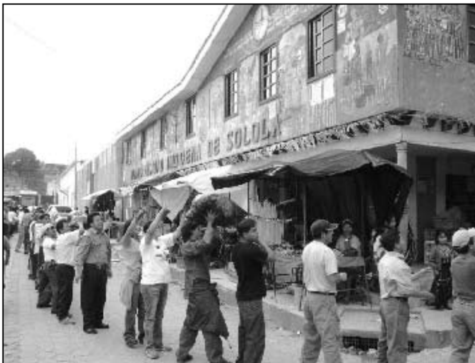
Habitantes de Sololá trabajando para hacer llegar ayuda a las víctimas del Stan.