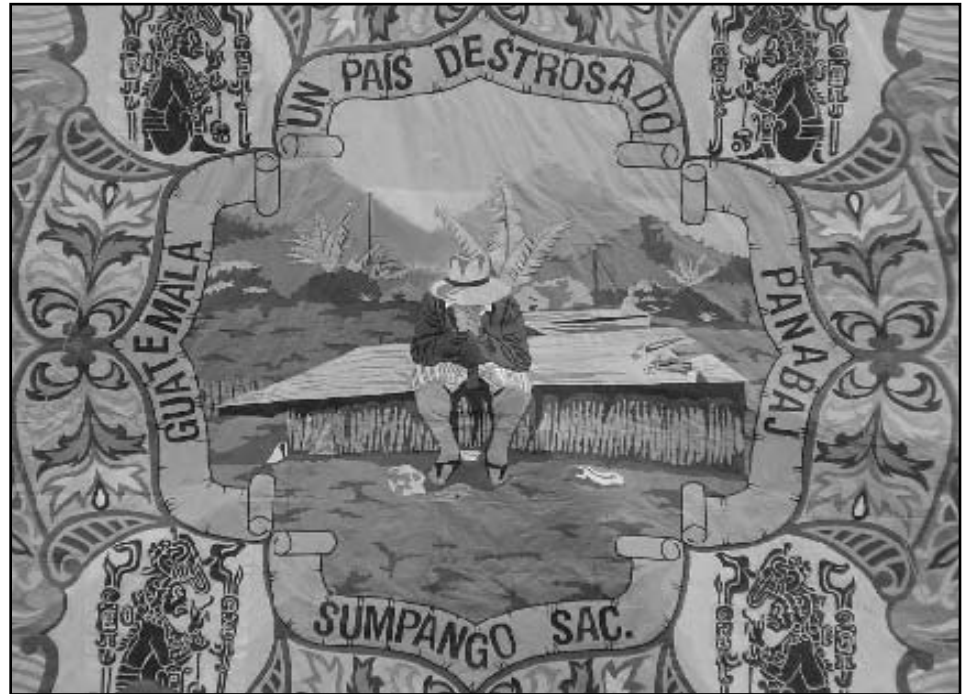
Barrilete en Sumpango en solidaridad con las víctimas del Stan en Panabaj.