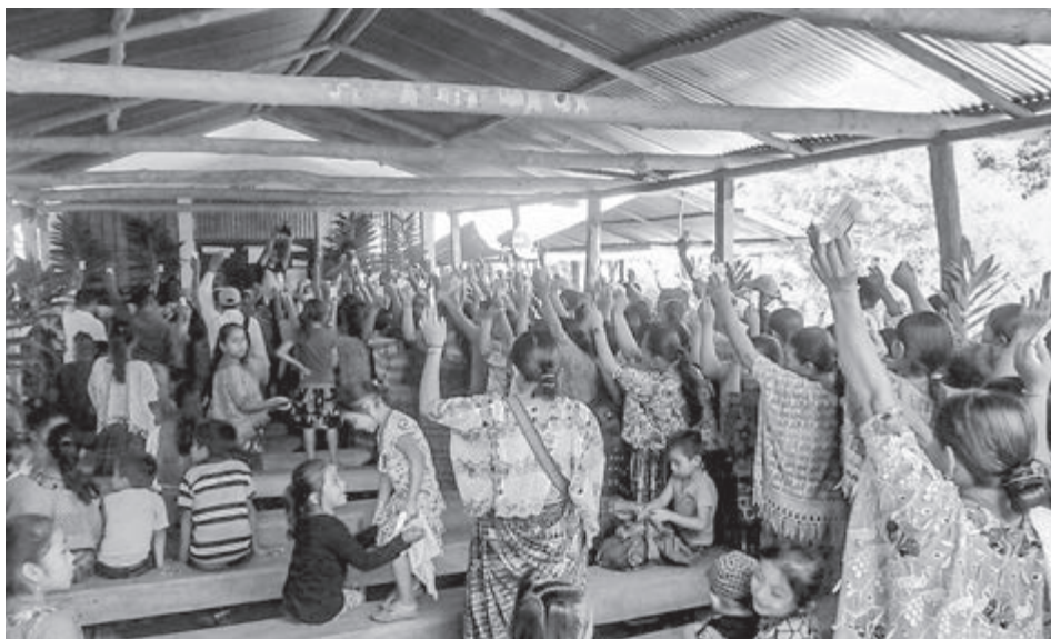
Consulta comunitaria Cahabón. Comunidad Salac I, Guatemala, 25.08.17.

Lo que hoy sucede con las aguas de OXEC, está lejos de la sabiduría ancestral de los pueblos indígenas. La empresa Oxec S.A., perteneciente al grupo Energy Resource Capital