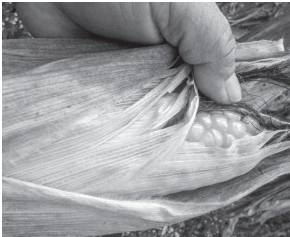
Elote recién cortado para consumo propio por una familia en Chinique, Quiché. 22 de noviembre de 2017.

sobre el gasto familiar priorizan la inversión en alimentación, salud y educación. Pero más allá del beneficio personal y familiar, ampliar el acceso de las mujeres a la tierra y otros activos productivos, así como a la asistencia técnica y financiera mejoraría la productividad agrícola hasta un 30%, lo que ayudaría a erradicar el hambre y la pobreza rural. Permitiría disponer de más alimentos y a menores precios en el mercado, contribuyendo a alcanzar la soberanía alimentaria. Y además mejoraría los niveles de empleo y de ingresos en las economías locales 13 .