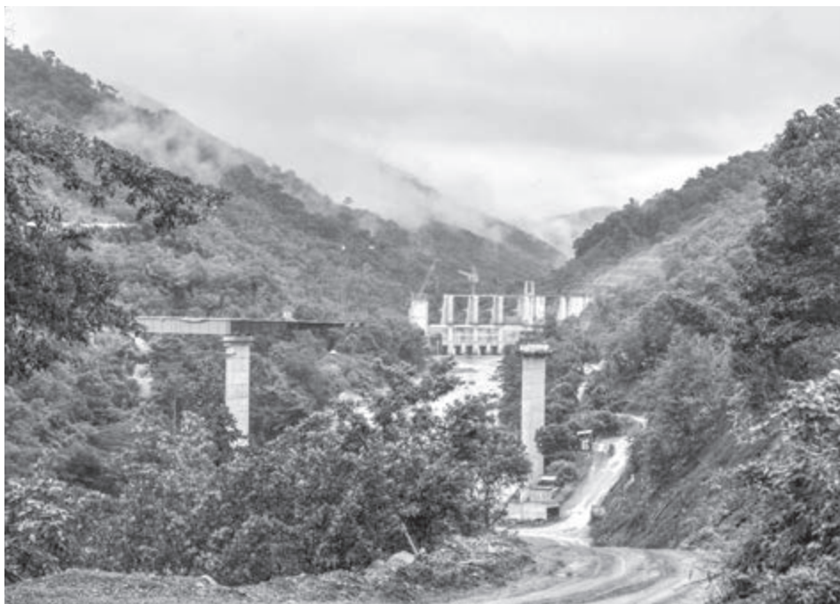
Panorámica hidroeléctrica Oxec. Guatemala, 12.05.2017.

PBI estuvo presente en la consulta comunitaria del 27 de agosto, de hecho este fue el inicio de nuestro acompañamiento a la Resistencia Pacífica de Cahabón.