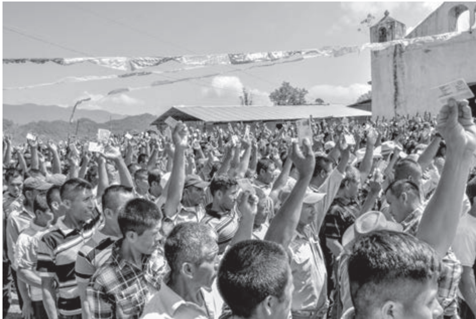
Consulta comunitaria Cahabón. Comunidad Pinares, Guatemala, 25.08.17.

de la gente. Desde 2012 han ofrecido grandes proyectos y no los cumplen. Se benefician unas cuantas personas, pero los demás siguen igual. Por eso, mucha gente que firmó, ahora ya no confía en la empresa 11 .