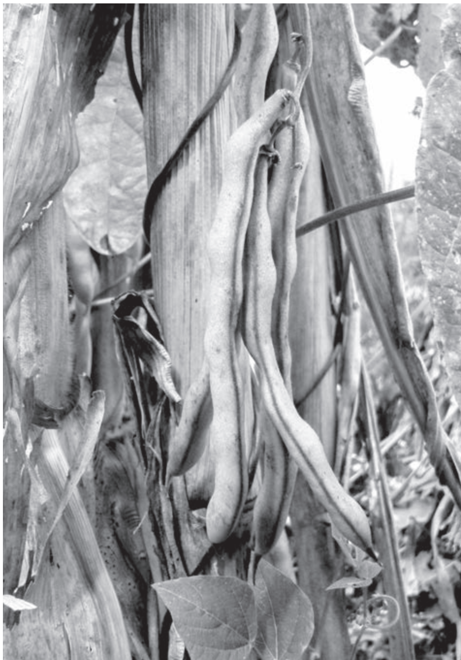
Frijol sembrado por una familia en Chinique, Quiché. 22 de noviembre de 2017.

A la luz de un panorama tan desalentador, se hace necesario ahondar en las causas que lo provocan, más aun cuando Guatemala cuenta con una amplia gama de bienes naturales, así como recursos gubernamentales destinados a garantizar el derecho a la alimentación. Según sostiene el científico guatemalteco César Azurdia el fondo del asunto es que esa riqueza no está distribuida de manera justa, porque el nuestro es uno de los países más desiguales en cuanto a la distribución de sus recursos. Lo que sucede es que esa biodiversidad es empleada por las naciones desarrolladas, las que le dan un valor agregado que queda allá y, a veces, regresa, pero se debe pagar muy caro, por ejemplo, las semillas mejoradas y las patentes. Nosotros también podemos tener un buen maíz pero ¿qué disponibilidad de tierra tienen nuestros agricultores? Una cuerda, dos cuerdas (...) si es que tienen, entonces