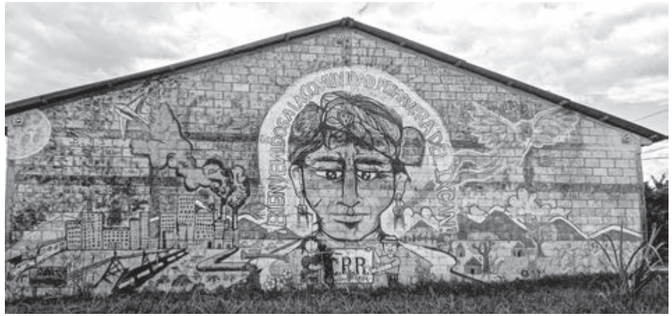
Mural en el salón comunitario de Primavera del Ixcán.